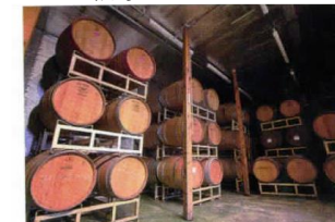
ワイン醸造の様子